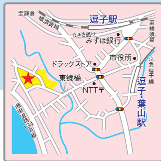
〔交通アクセス〕 JR横須賀線「逗子」駅、京急線「逗子・葉山」駅より徒歩10分