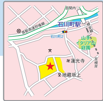
(交通アクセス) JR根岸線「石川町」駅より徒歩10分