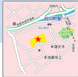
(交通アクセス) JR根岸線「石川町」駅より徒歩7分