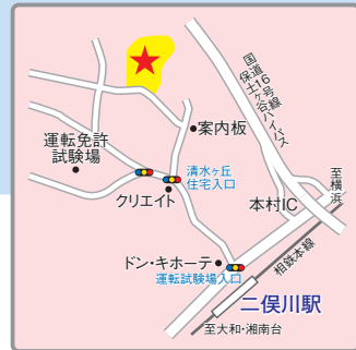
(交通アクセス) 相鉄線「二俣川」駅より徒歩15分