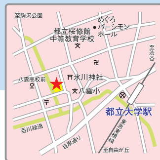
〈交通アクセス〉 東急東横線「都立大学」駅より徒歩7分