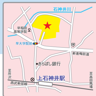
(交通アクセス) 西武新宿線「上石神井」駅より徒歩7分