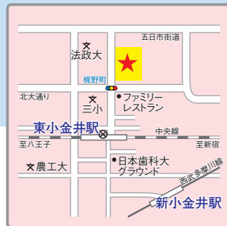
(交通アクセス) JR「東小金井」駅より徒歩5分