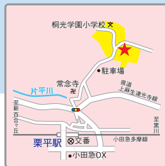
(交通アクセス) 小田急多摩線「栗平」駅より徒歩12分