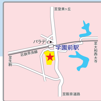
(交通アクセス) 近鉄奈良線「学園前」駅すぐ