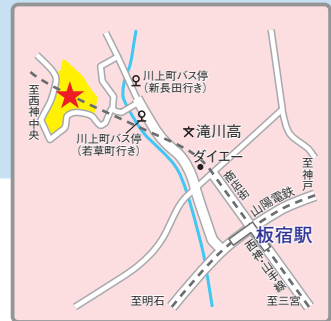
(交通アクセス) 神戸市営地下鉄、山陽電鉄「板宿」駅より徒歩 15分