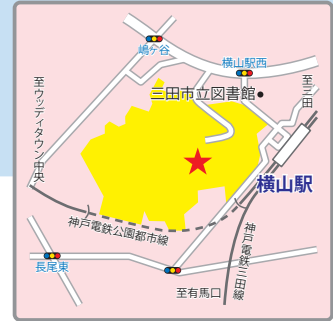
(交通アクセス) 神戸電鉄「横山」駅よりすぐ