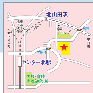
(交通アクセス) 横浜市営地下鉄「北山田」駅より徒歩5分