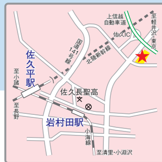
〈中学への交通アクセス〉 JR「佐久平」「岩村田」駅よりスクールバスを 運行 上信越自動車道佐久インターから車で1分