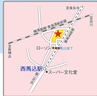
〔交通アクセス〕 都営浅草線「西馬込」駅より徒歩5分 東急バス反01反02系統 「立正大学付属立正中高前」停留所より徒歩2分