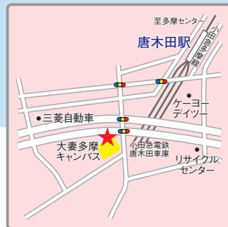
(交通アクセス) 小田急線「唐木田」駅より徒歩7分