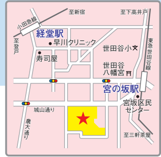
交通アクセス 小田急線「経堂」駅より徒歩8分 東急世田谷線「宮の坂」駅より徒歩4分