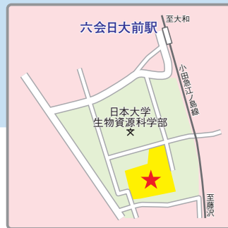
(交通アクセス) 小田急江ノ島線「六会日大前」駅より徒歩8分