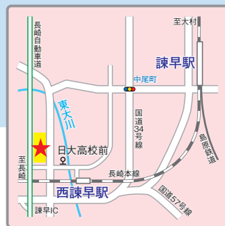
(交通アクセス) JR長崎本線「西諫早」駅より徒歩10分