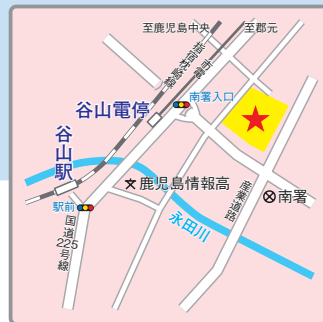
(交通アクセス) 市電「谷山電停」駅より徒歩5分 JR指宿枕崎 線「谷山」駅より徒歩15分