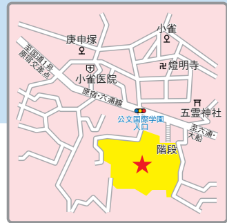
〔交通アクセス〕 JR東海道線ほか「大船」駅より直通バス8分 神奈川中央バス「小雀」下車徒歩5分