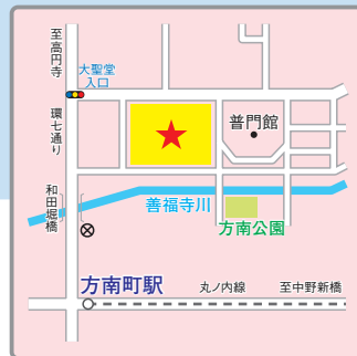
(交通アクセス) 東京メトロ丸ノ内線「方南町」駅より徒歩5分