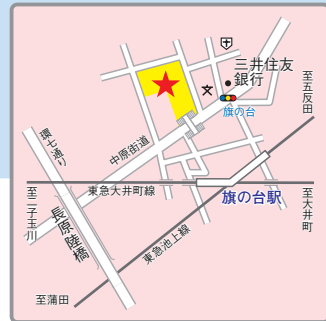
(交通アクセス) 東急大井町線・池上線「旗の台」駅より徒歩5分