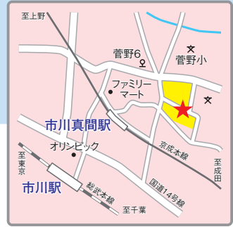
(交通アクセス) JR総武線「市川」駅より徒歩12分 京成線「市川真間」駅より徒歩5分