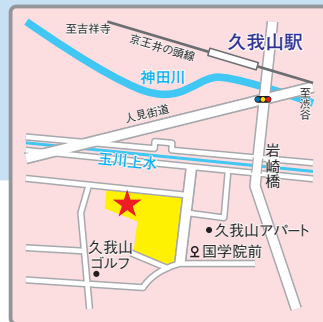
〔交通アクセス〕 京王井の頭線「久我山」駅より徒歩12分 京王線「千歳烏山」駅よりバス10分