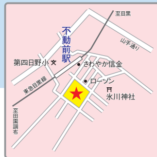
(交通アクセス) 東急目黒線「不動前」駅より徒歩1分