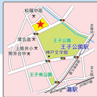
(交通アクセス) 阪急神戸線「王子公園」駅より徒歩12分 JR神戸線「灘」駅より徒歩13分