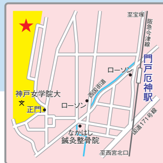
(交通アクセス) 阪急今津線「門戸厄神」駅より徒歩15分