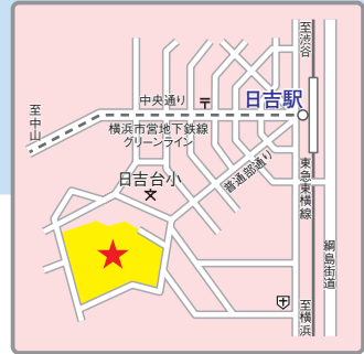
(交通アクセス) 東急東横線、東急目黒線、東急新横浜線、横浜市営地下鉄グリーンライン「日吉」駅より徒歩5分