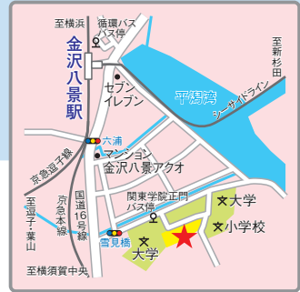
〈交通アクセス〉 京急線「金沢八景」駅より徒歩15分、バスの便あり