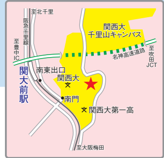
(交通アクセス) 阪急千里線「関大前」駅より徒歩3分