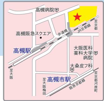
〈交通アクセス〉 JR東海道本線・京都線「高槻」駅より徒歩7分 阪急京都線「高槻市」駅より徒歩10分