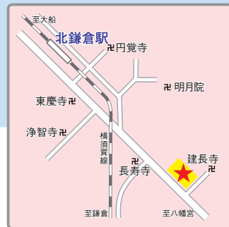
(交通アクセス) JR横須賀線「北鎌倉」駅より徒歩13分