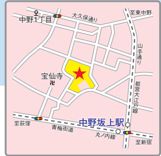
〈交通アクセス〉 東京メトロ丸ノ内線、都営大江戸線「中野坂上」駅より徒歩5分