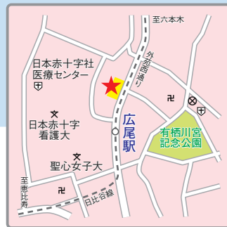
〈交通アクセス〉 東京メトロ日比谷線「広尾」駅より徒歩すぐ