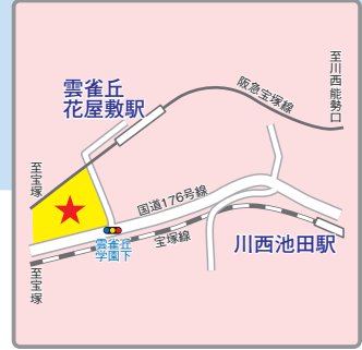
(交通アクセス) 阪急宝塚線「雲雀丘花屋敷」駅より徒歩3分 JR宝塚線「川西池田」駅より徒歩12分