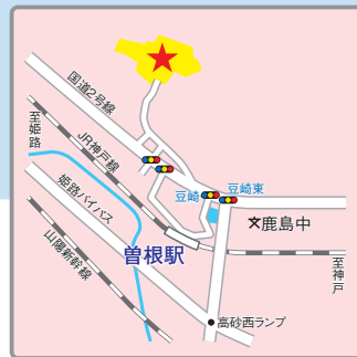
(交通アクセス) JR神戸線「曽根」駅より徒歩15分