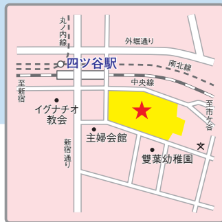
(交通アクセス) JR、東京メトロ「四ツ谷」駅より徒歩2分