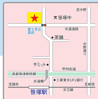
(交通アクセス) 京王線・都営新宿線「笹塚」駅より徒歩5分