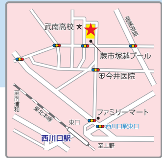
(交通アクセス) JR京浜東北線「西川口」駅より徒歩10分