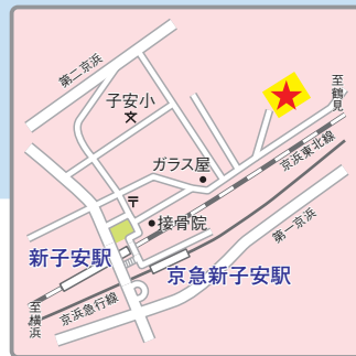
〈交通アクセス〉 JR京浜東北線、京急線「新子安」駅より徒歩8分