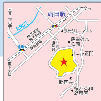
(交通アクセス) 横浜市営地下鉄「蒔田」駅より徒歩8分 京急線「井土ヶ谷」駅より徒歩18分