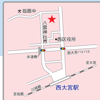
(交通アクセス) JR埼京線・川越線(りんかい線直通)「西大宮」 駅より徒歩4分