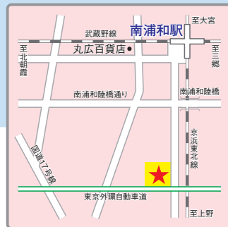
(交通アクセス) JR武蔵野線、京浜東北線「南浦和」駅より徒歩14分