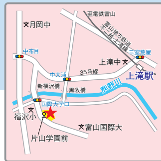
(交通アクセス) JR「富山」駅よりバス30分